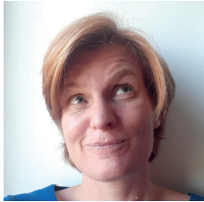
Auteur Benedicte Leroy Commissiedirecteur